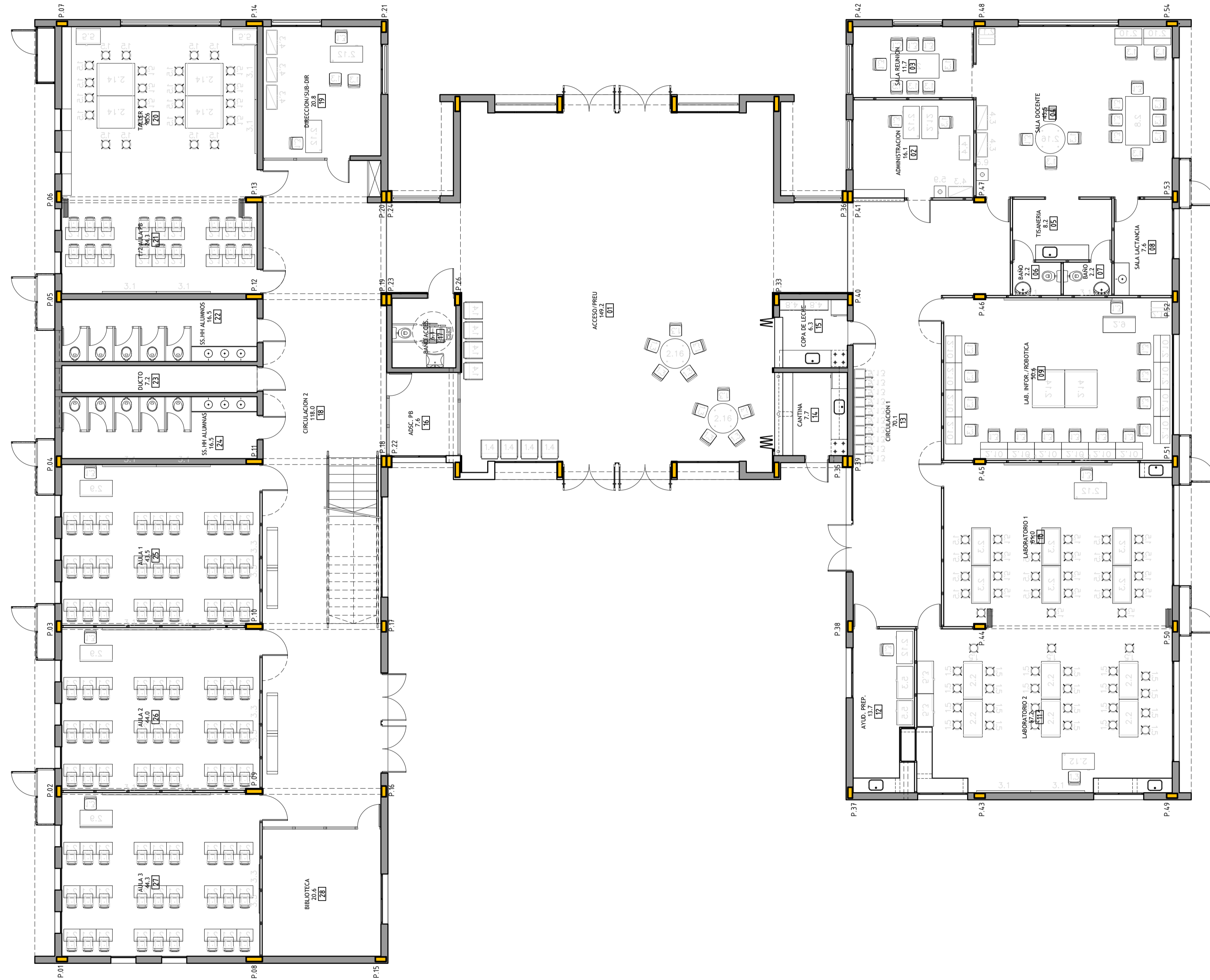
PLANTA BAJA - Escala 1:100